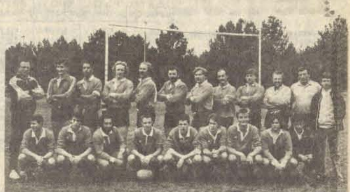
L'équipe des seniors B

ASSAM, 8; Cénac, 7. — Si la victoire est courte, 8 à 7, elle est largement méritée. Les petits bleus se créent beaucoup plus d'occasions que les visiteurs.