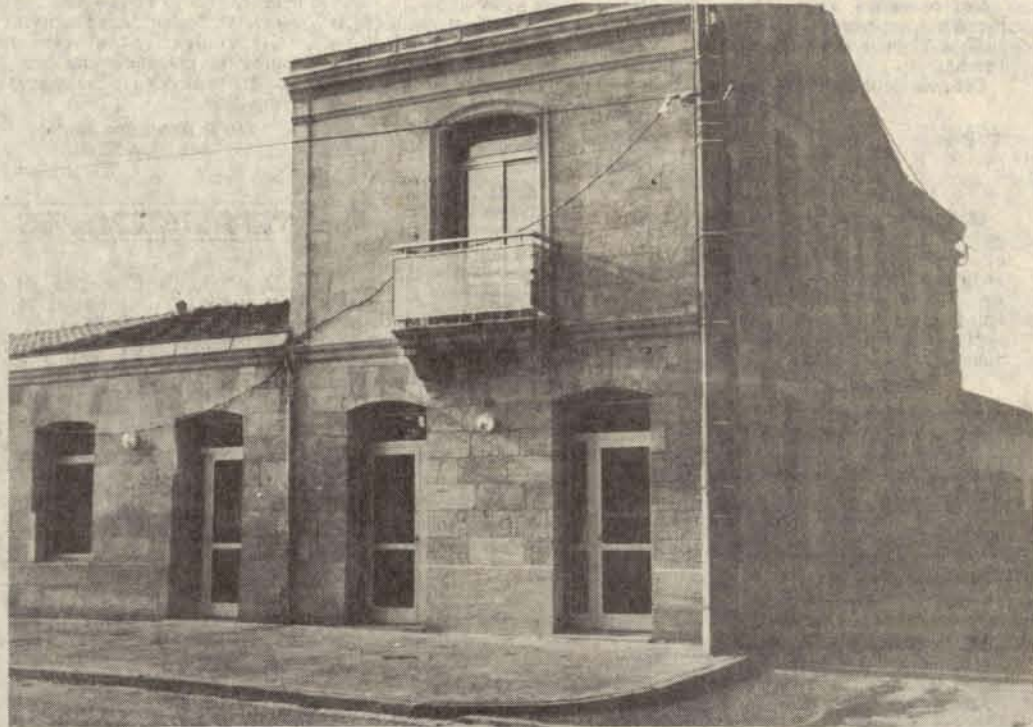
L'immeuble restauré qui servira de bibliothèque

Commencée en 1985, la bibliothèque ouvrira officiellement ses portes le mercredi 2 décembre