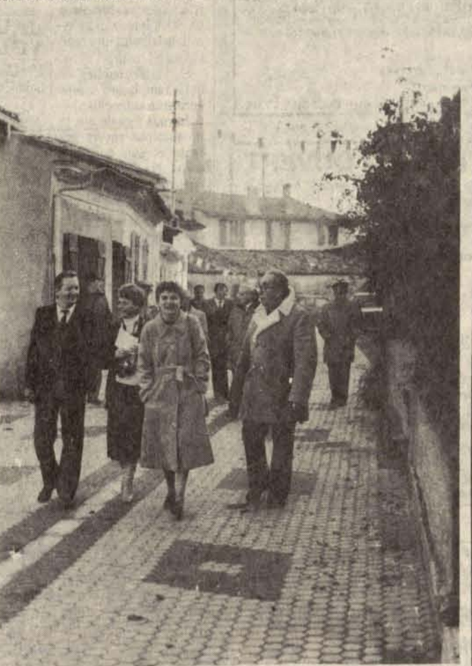
Promenade dans le vieux bourg

Comme toujours en France le parcours s'acheva par des discours et un buffet qui prit un relief particulier puisqu'il fut partagé avec les meilleurs ouvriers de France au milieu de leurs merveilleux chefs-d'œuvres.