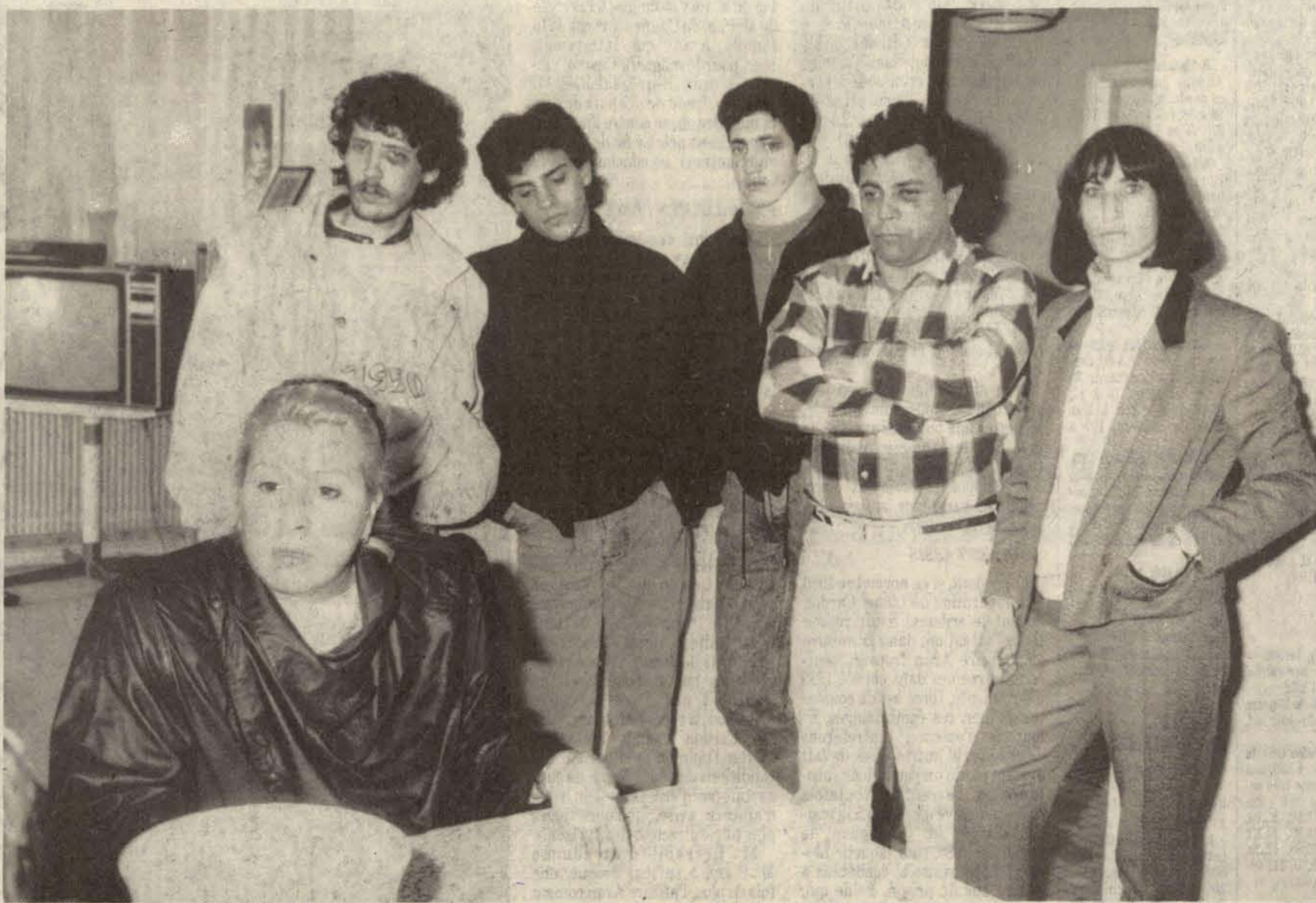
Toute la famille souffre de nombreuses contusions

Cinq personnes dont une femme et deux jeunes de 16 ans ont été sérieusement blessés dans une bagarre avec les rugbymen de Villenave-d'Ornon